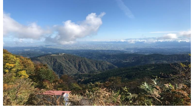
【牛岳山頂からの眺め 987m】