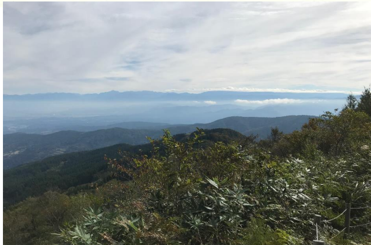
【山頂から見る立山連峰】